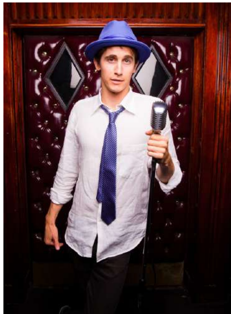
SHOW DE STAND UP O ARTISTAS MUSICALES

Contamos con una variedad enorme de artistas de diferentes rubros y que tienen mucha experiencia en el mundo online para hacer de tu evento, un momento inolvidable.