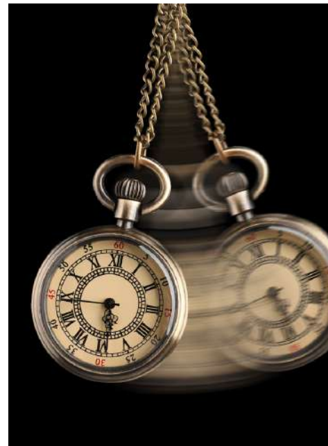
MENTALISMO, MAGIA Y HUMOR.